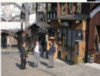
アイヌコタン(釧路市阿寒町) (5月15日)