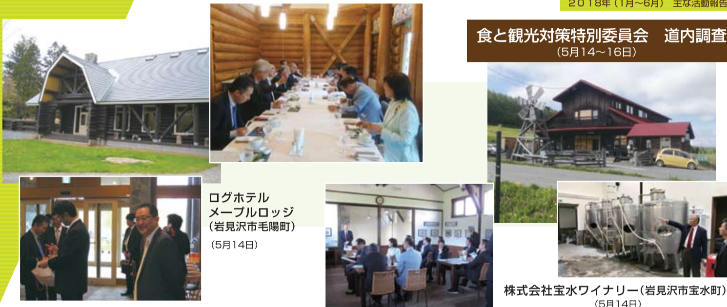
ログホテル メープルロッジ (岩見沢市毛陽町) (5月14日)