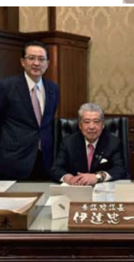
参議院訪問 (3月30日) 伊達忠一参議院議長に北海道、空知の状況と課題等を報告させて頂きました。