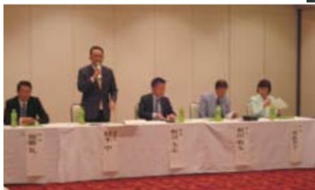
地域意見交換会(岩見沢市 ホテルサンプラザ) (5月14日) 地域資源を活用した観光振興の課題等について