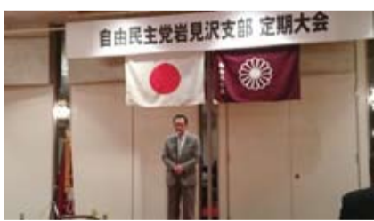
自由民主党岩見沢支部定期大会 (4月9日)