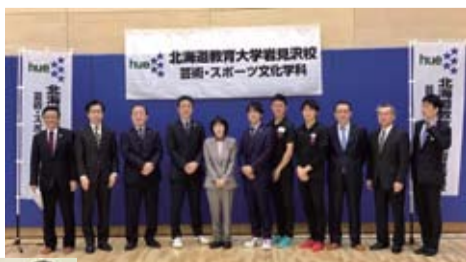
北海道教育大学にて意見交換 (岩見沢市) (2月23日) 高橋はるみ知事が来岩され教育大で「アダプテッドスポーツの取組み」等について意見交換会をさせていただきました。