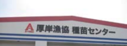
厚岸漁業協同組合 (カキ人口種苗生産施設) (5月16日)