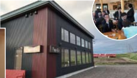
懇談会(岩見沢市栗沢町 大地のテラス) (5月14日)