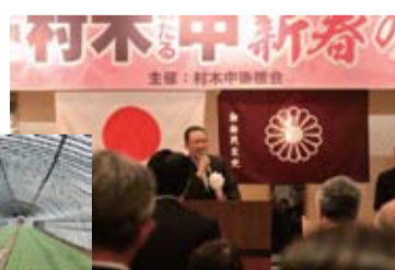
村木中新春の集い (2月15日)