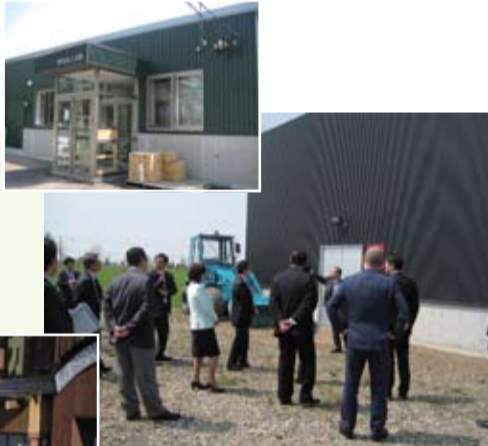
北海道スノーフード研究会 ホワイト・ラボ(美唄市) (5月15日)