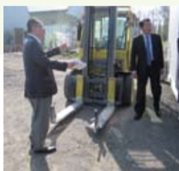
北泉開発株式会社(釧路市阿寒町) (5月15日)