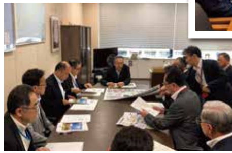
国土交通省 北海道局で北海道 予算要望(7月29日 東京)