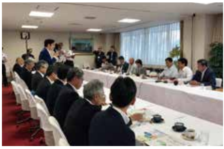
国の施策及び予算に関する提案・要望会 (7月29日 自民党本部)