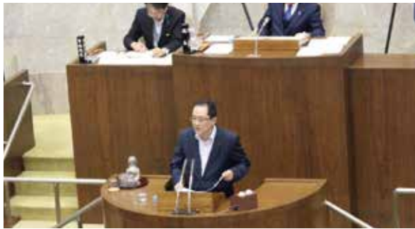
本会議 一般質問(9月25日)