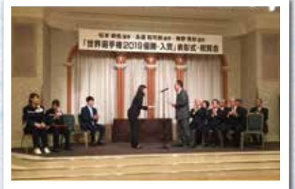
北海道バドミントン協会 世界選手権2019 優勝・入賞 表彰式・祝賀会(12月23日)