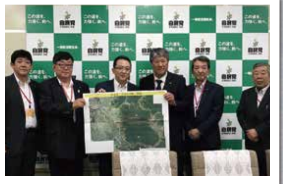
栗山町議会、夕張市議会から自民党・道議会へ 夕張~長沼線 整備状況要請・要望(8月29日)