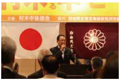
村木中ビール祭り(7月26日)