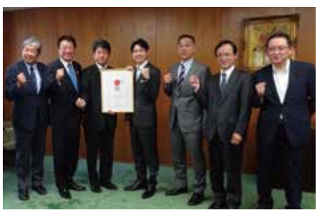
「炭鉄港」日本遺産登録 報告会(5月28日)