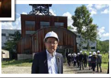
産炭地域振興・ エネルギー問題 調査特別委員会 道内調査 (8月27日 赤平市)