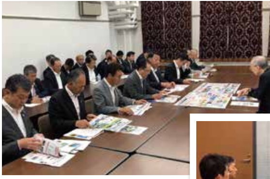
財務省で北海道開発 予算等の要望会 (7月29日 東京)