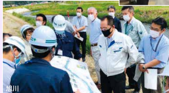
建設常任委員会道内調査(8月24日～26日)