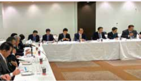
北海道・東北六県議会 研究交流大会(福島県) (1月24日)