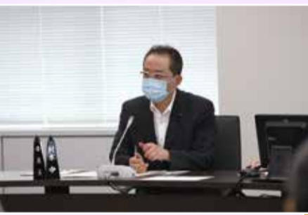
建設常任委員会(6月2日)