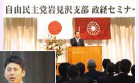
自由民主党岩見沢支部 政経セミナー(2月15日)