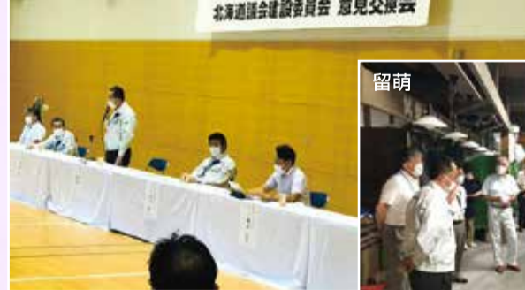
建設常任委員会道内調査(8月24日～26日)