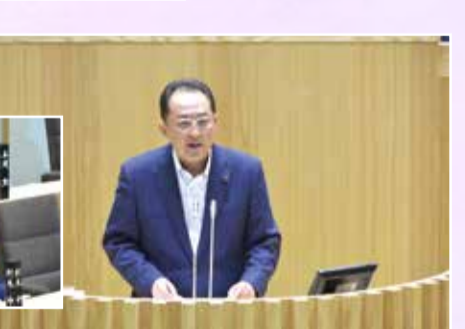
道議会本会議一般質問(9月23日)