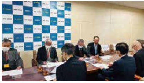
岩見沢市内道立普通科高等学校統合に関する要望調整会議の進捗状況について道教委と意見交換を行いました。