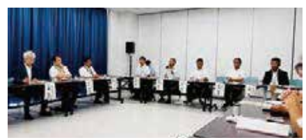
大空町 (株) MEIGUMI、小清水町アグリハートセンターを視察し、意見交換。