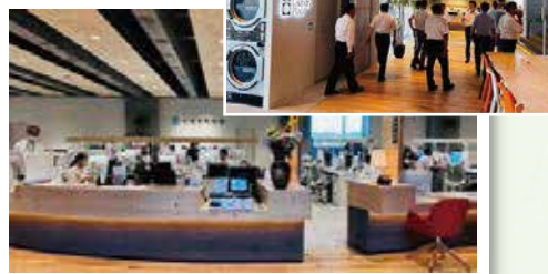
小清水町役場は商工会、カフェ、コインランドリー、フィットネスジムを併設した素晴らしい「複合施設」で驚きました。