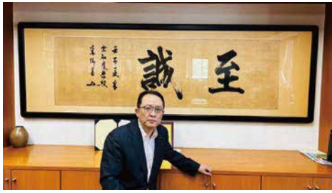
2025年統合される岩見沢東高校と西高校。新設道立高等学校は文武両道を目指し、道教委皆様のお力添えで一步一步しっかりと前進しております。