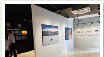
鶴雅グループ 15 施設目になる【阿寒テラス】【阿寒アートギャラリー】を視察