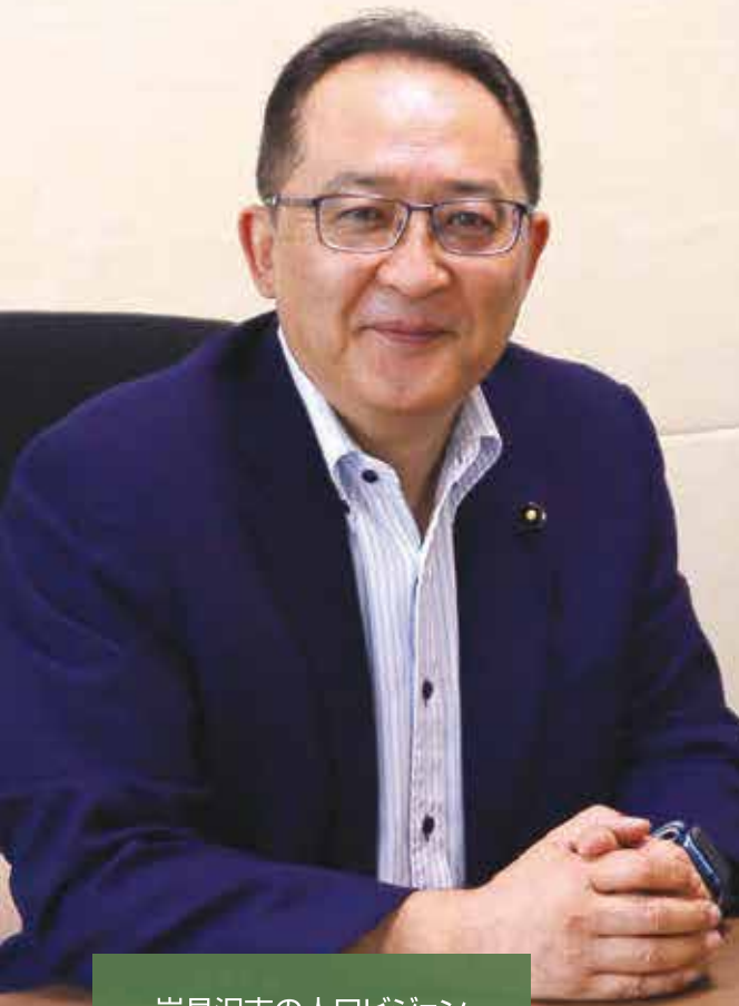
岩見沢市の人口ビジョン (2015~2045)

発行所：北海道議会議員 村木中事務所 発行責任者：若林 利行 〒068-0024 岩見沢市4条西8丁目1番地ヤマシチ4・8ビル3F TEL(0126)33-6611 FAX(0126)24-6668