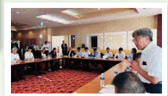
オホーツク観光連盟、知床斜里町観光協会、知床小型観光船協議会の皆様と意見交換