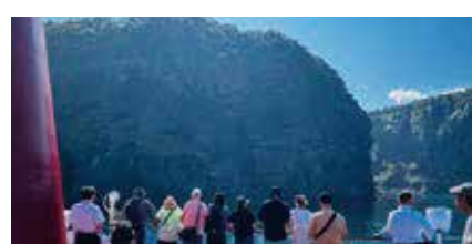
知床観光船オーロラ号に乗船し、航路カムイワッカの滝を視察