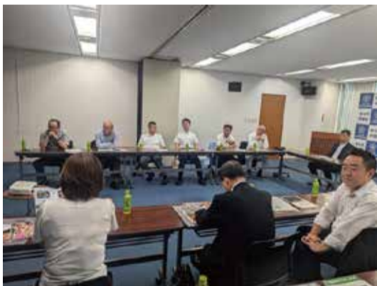
北九州市のフィルム・コミッション事業について意見交換会