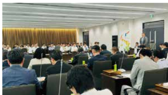
北海道議会スポーツ振興議員連盟総会(2024.7.4)