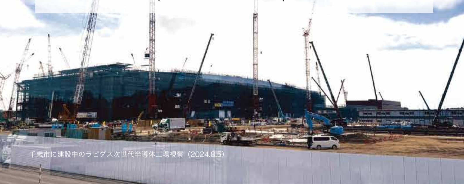
千歳市に建設中のラピダス次世代半導体工場視察 (2024.8.5)