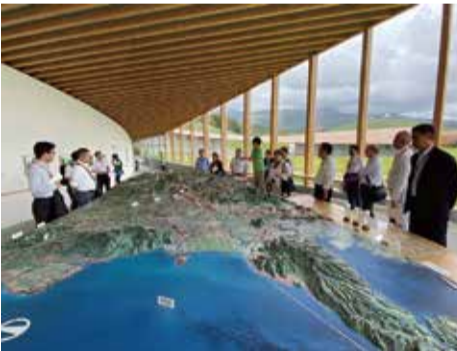
震災ミュージアム KIOKU