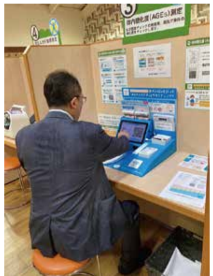
阿蘇バイオテック(株)、阿蘇ファームランド(株)